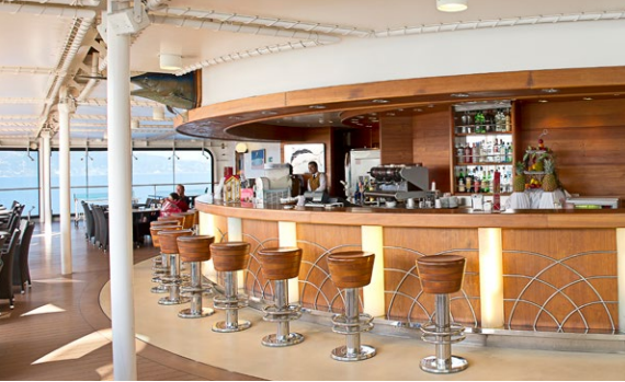
BLUE MARLIN BAR