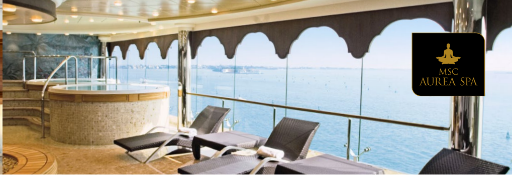
MSC AUREA SPA