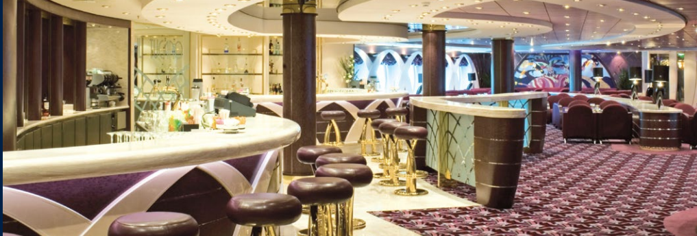
IL TUCANO LOUNGE