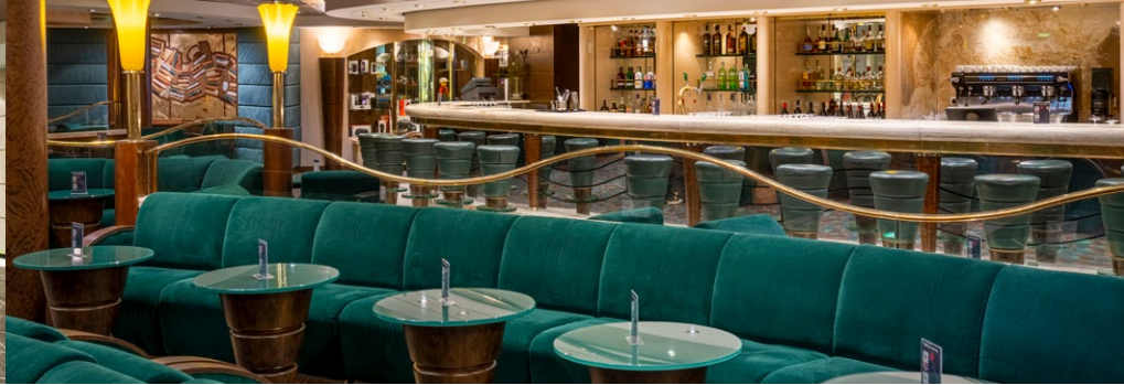
THE AMBER BAR